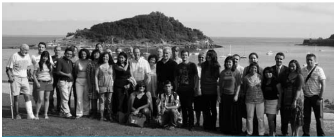
'Bakea, giza eskubide: nazioarteko kodifikazio prozesurantz' Uda ikastaroa. Abuztuaren 17tik-18ra. Donostia.

Euskal Herriko Unibertsitatearen (UPV/EHU) XXVIII. Udako Ikastaroetan, ikastaro bat antolatu dugu: La paz como un derecho humano: Hacia un proceso de codificación internacional [Bakea, giza eskubide: nazioarteko kodifikazio prozesurantz].