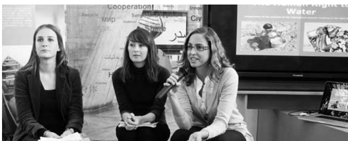
UNESCOren Batzar Nagusia. Ura izateko Giza Eskubideari buruzko ekitaldi paraleloa. Urriaren 19an. Paris.