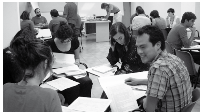
'Klima-aldaketa: garapenerako mehatxua. Garapenerako lankidetzaren eginkizuna, mundu-mailako erronkaren aurrean' prestakuntza-ibilbidea. Ekainaren 1tik 17ra. Bilbao.