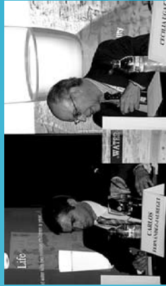
2008 Munduko aurkezpena: "El derecho humano al agua. Situación actual y retos de futuro".