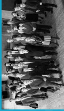
2007 Hitzaldia: "Los límites del crecimiento, 30 años después". Dennis Meadows. Deustuko Unibertsitatea.