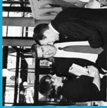
2001 Congreso Internacional del Voluntariado. Victoria-Gasteiz.