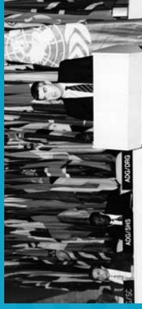
1999 Intervención de Paul Ortega en la Conferencia General de la UNESCO.