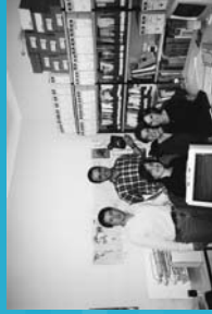
1997 Inicio del Proyecto del Informe sobre las lenguas del mundo.