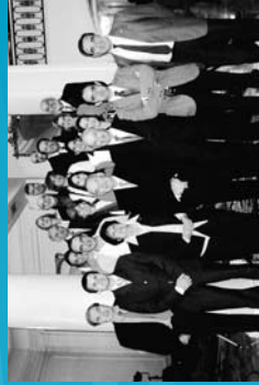
2005 Constitución del Consejo Asesor de Socioe de Honor y Declaración sobre Diversidad Cultural.