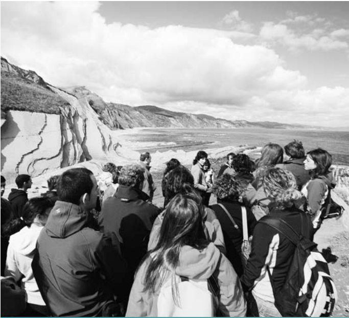
Euskal Herriko geodibertsitateari buruzko jardunaldiak. Landa-irteera. Zumaia, maiatzaren 14a.