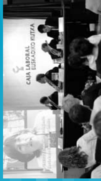
2008 Giza Eskubideen Aldarrikaparen 60. urtemugaren ospakizuna. Euskadiko Kubaren aktibaldi aietara. Bilbao.