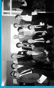
1994 Primeras Jornadas de Irdubai.