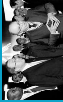
2008 Nazio Batuen eguna. Expo Zaragoza.