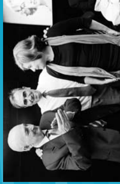
2009 Beghina Ekiberrari omenaldia. UNESCO Etxearen intsigiari emateko ekitaldia.