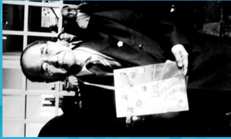
2008 Uraren Garapenera buruzko Munduko II. Txostenaren aurkezpena (gaztelaniaz eta euskaraz). UNESCOren Zuzendaritza Nagusia. Mexiko D.F.