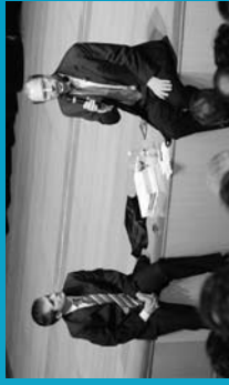
2007 Hitzaldia: "Alfka eta HESa: Justiza erantzun gisa". Peter Piot. Guggenheim museoa.