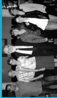
2007 Hitzaldia: "Zer gini ibakuntza gurtzituak bizian dezanen". David Crystal.