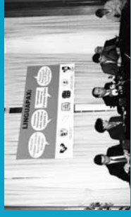
1996 Seminario Internacional Linguapax de la UNESCO sobre Políticas Lingüísticas (Leiz). Primera visita oficial de un director general de UNESCO a Euzkadi.