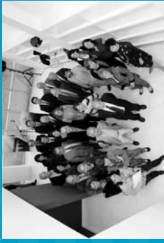
2009 UNESCO Etxearen epizita berraren inaugurazioa. Idozaki atea - Bizkaitasun plaza. Bilbao.