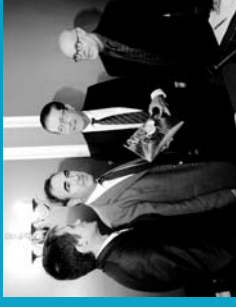
2005 Primera Memoria Anual de Actividades.