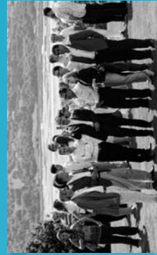
2009 Madrilatiko Bileren Boskora Erreserbelatuako UNESCO Kulturak.