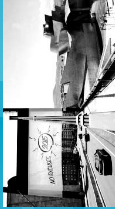
2005 Campaña Mundial de la Banda Blanca por los "Objetivos de Desarrollo del Milenio".