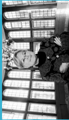
2004 Adhesión de Euzkadi a la Declaración de Objetivos del Milenio.