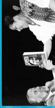
1999 Inicio del programa "Experiencias de cultura de paz en el mundo: conflictos en vías de solución".