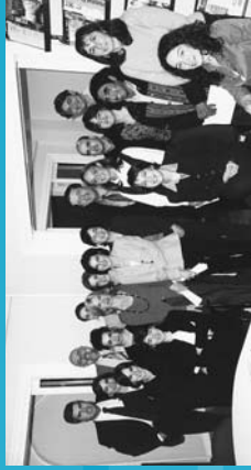
2000 Homenaje a Federico Mayor Zaragoza.