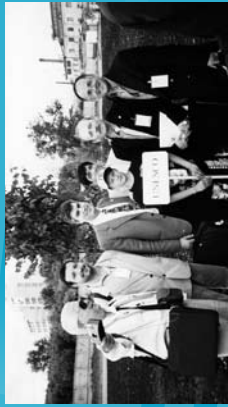
1999 Presidencia de la FMCU/WFUCA (Esteremburgo, Rusia)