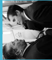
2009 Ohorazko Bazterdaren Aholku Batzordearen bururako 3. topaketa eta "Gizarte zibilaren parte-hartzea multilateralismo berrian" adierazpena. Bilbao.