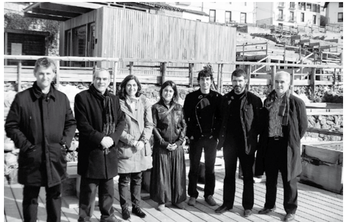
ICOMOS Gesaltza-Añanan izan zen. Otsailak 11.

UNESCO Etxeak ahalegin handia egin du 2011. urtean giza garapenaren arloan zeharka kultura ere aintzat hartzeko, eta erakundearen lan-esparru guztiak hartu ditu horretarako oinarri.