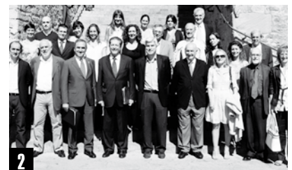
Hezkuntza, Zientzia eta Kulturarako Nazio Batuen Erakundea · centro unesco euskal herria · centre unesco pays basque · unesco centre basque country