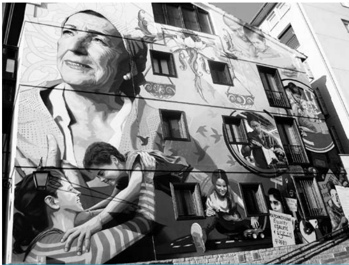
'Itxaropen Argia' horma-irudi. Anorbin kantoia, Gasteiz.

2011. urtean, UNESCO Etxeak leial eta tinko eutsi dio bere oinarrietako bati: Bakearen Kultura da humanismo berriaren funtsa. Gizarte egiaz demokratikoa, irekia, parte-hartezkoa, tolerantia eta bidezkoa eraikiko badugu, hau da, pertsona guztien giza eskubideak errespetatzeko konpromisoa bere gain hartuko duen gizarte hezurmamituko badugu, lanean jarraitu behar dugu, botere publikoetan eragiten saiatzen eta herritarren erantzukizun kontzientea eta abixkimendua lortzen.