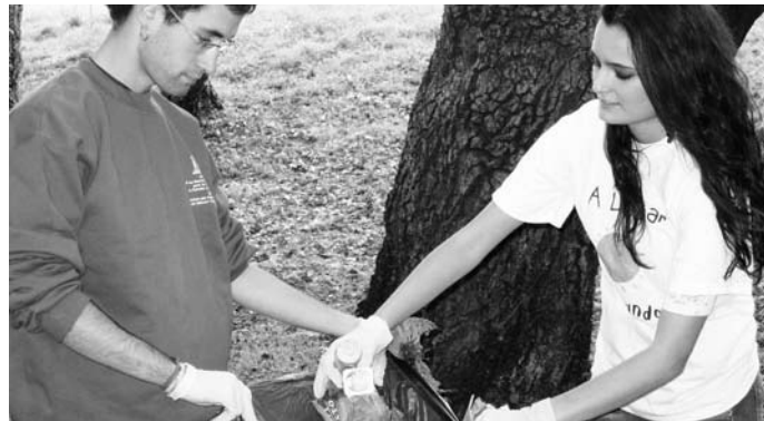
'Garbitu dezagun mundua' ekimena. Lauaxeta ikastola, Arriandi parkeko garbiketaria. Amorebieta-Etxano, urriak 27.

Beste hainbat ekimenen artean, Nazio Batuen Ingurumenerako Programak (PNUMA) babestutako 'Garbitu dezagun mundua' nazioarteko ingurumen kanpaina koordinatu dugu EAEn, ingurumena garbitzea, berreskuratzea eta kontserbatzea helburutzat harturik. Garapen Iraunkorrerako Hezkuntzari buruzko Nazio Batuen Hamarraldian gure hondar alea izan da kanpainaren koordinazio-lan hori. Horrez gain, euskaraz eta gaztelaniaz argitaratu dugu 'Etorbizun Iraunkorrerako Irakaskuntza eta Ikaskuntza' hezkuntzarako multimedia materiala.