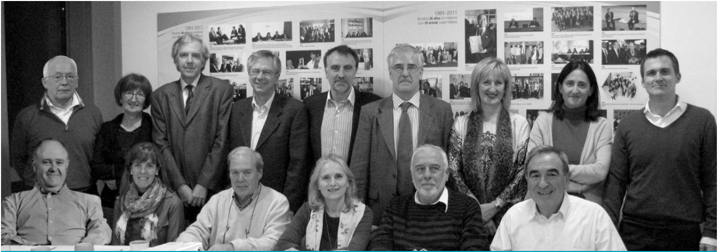
UNESCO Etxeko Gobernu Kontseilua. 2013ko maiatza.

2012. urtea zaila izan da ekonomiaren arloan. Lantaldeari sakrifizio handiak eskatu dizkiogu, batez ere soldatari dagokionez, eta hemen nabarmentzeko eta eskertzeko moduko erantzukizun profesional eta erakundearekiko estimazioz onartu dituzte.