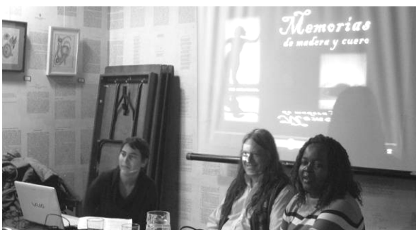
'Memorias de madera y cuero: el candombe en claves de género y Patrimonio' dokumentalaren aurkezpena. Gasteiz. Abenduak 19

2012. urtean, UNESCO Etxeak jarraitu egin zuen kultura giza garapenean txertatzeko lanarekin. Horretarako, hainbat jardueratan lagundu zuen, hala nola Ama-hizkuntzaren Nazioarteko Egunaren antolaketan eta UNESCOren Munduko Ondarearen Konbentzioaren 40. Urteurrenean. Halaber, estatuko nahiz nazioarteko hainbat topaketatan hartu zuen parte, besteak beste, 'Munduko Ondarearen Kudeatzaileen Espainiako VI. Topaketan', 'Internet eta hizkuntza-aniztasunaren sustapenari buruzko jardunaldian', 'Kultura, afrikar identitateak eta tokiko giza garapenari buruzko mintegian' eta 'Kultura Ondarea, Iraunkortasuna eta Tokiko Garapenari buruzko jardunaldietan'; prestakuntza-ekintzak ere egin zituen, hala nola 'Ura-bizitzaren esparruak: kultura eta demokrazia' lantegia.