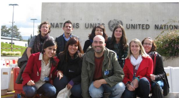
'Human Rights Internship Programme' III. Edizioan parte-hartzaileak Nazio Batuek. Geneva. 2013ko irailak 6-20.

Hemen bertan eta nazioartean Bakearen Kultura eta giza eskubideak sustatzeko jarraitzen du gure nortasun-ezaugarrietako bat izaten.