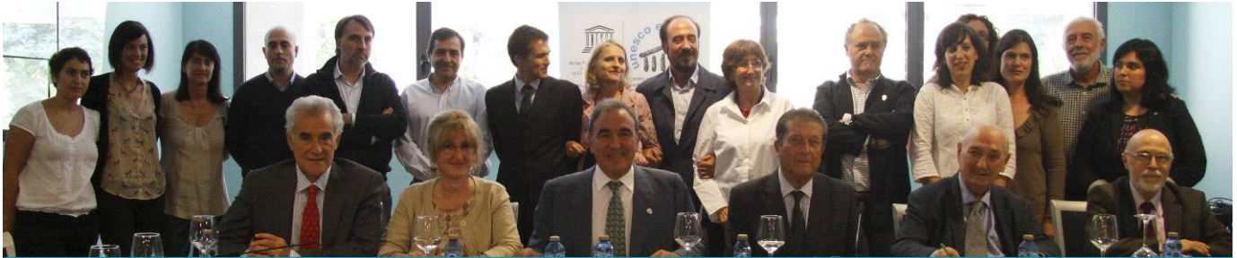
UNESCO Etxeko Ohorezko Bazkideak, Gobernu Kontseilua eta Lan-taldea. Ohorezko Bazkideen Aholku Batzordearen Biurteko 5. Topaketa. "Herriarren parte-hartzea eta erantzukizuna demokrazia hobeto baterako" Adierazpenaren aurkezpena. Bilbo. 2013ko Irailaren 21a.

Gauzak gogora ekartzea ariketa pertsonal eta instituzional ona da, egunetik egunera gauzez gehiago jabetzeko eta garenaren alde egiten jarraitzeko, beti doikuntzak eginez eta gure erronkak berrituz.