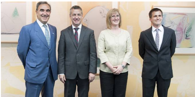
Iñigo Urkullu Lehendakariarekin bilera. Gasteiz. 2013ko ekainak

Horregatik, 2013an ere hazi egin gara: beste 11 bazkide egin ditugu. Beraz, hiru baja izan ditugunez, 8 bazkideko hazkunde osoa izan dugu. Bazkide berri horiek ere UNESCO ETXEAREN proiektuan sinesten dute eta proiektu horrekin engaiatu dira. Era berean, lankidetzan arituko dira gure erronkak bultzatzeko, eta ezagutza, babesa, askotariko elkarlana eta baliabide ekonomikoak emango dituzte. Bazkideak dira, lehen-lehenik, euskal gizarteak UNESCO ETXEAREKIN duen konplizitatearen eta UNESCO ETXEAK gizartearekin duen konplizitatearen adierazgarri; UNESCO ETXEAK, hain zuzen, gizarterako baliagarri izan nahi du, eta onura eman nahi dio.