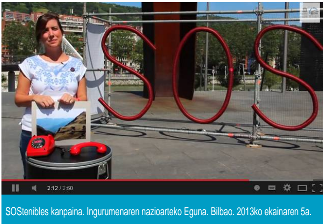
SOSTenibles kanpaina. Ingurumenaren nazioarteko Eguna. Bilbao. 2013ko ekainaren 5a.

UNESCO Etxea sortu zenetik egon da Urdaibaiko Biosfera Erreserbari lotuta, eta 2013an lanean aritu gara nazioartean natura- eta kultura-ondare horri garrantzia ematen jarraitzeko.