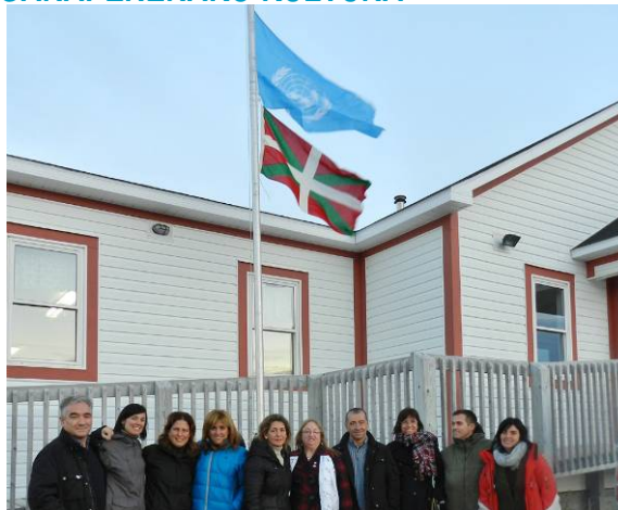
Red Bay, Euskal baleontzien ehizagunea, Munduko Ondarea.