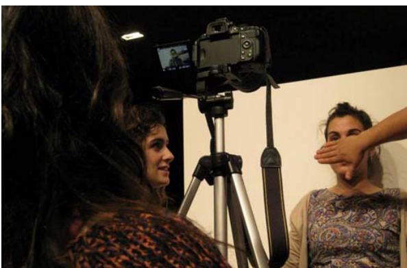
'Aniztasunera Leioa', Lankidetzazko-arte proiektuko Tailerrak. Bilbao, 2014ko otsaila – martxo

2015aren ondoko agendaren definizioaren esparruan, segida eman dio UNESCO Etxeak 2014. urte osoan zehar kultura giza garapenean marnitzeko lanari. Xede horri begira, nazioarteko kanpainetan hartu dugu parte –horra 'My World', UNESCOk, UNFPA, Nazio Batuen Populazio Ekitaldietarako Funtzak eta NBGP, Nazio Batuen Garapenerako Programak bultzaturiko kanpaina–, eta heziketa eta sentsibilizazio ekintzak bururatu ditugu, 'Arraza bat, herri asko' argazki erakusketa eta 'Garapenerako agenda berria: giza eskubideak eta kultura 2015aren ondoan' mintegia, besteak beste. Beste urte batzuetan bezala, Ama Hizkuntzaren Nazioarteko Eguna eta Aniztasunaren Eguna ere ospatu ditugu.