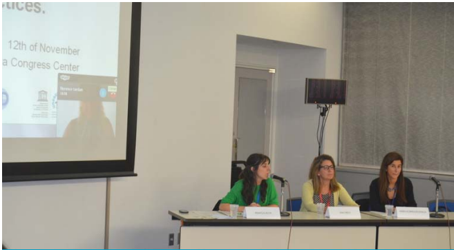
Garapen Iraunkorraren aldeko Hezkuntzari buruzko Munduko Konferentzia. Ekitaldi paraleloa 'The implementation of ESD in local governments. Good practices'. Aichi-Nagoya, Japonia. 2014ko azaroak 12

2014. urtean zehar, UNESCO Etxeak euskal gizartearekin batean segitu du lanean ingurumenaren iraunkortasuna etengabe giza garapenaren berezko eta sailhestezinezko osagaizat har dadin.