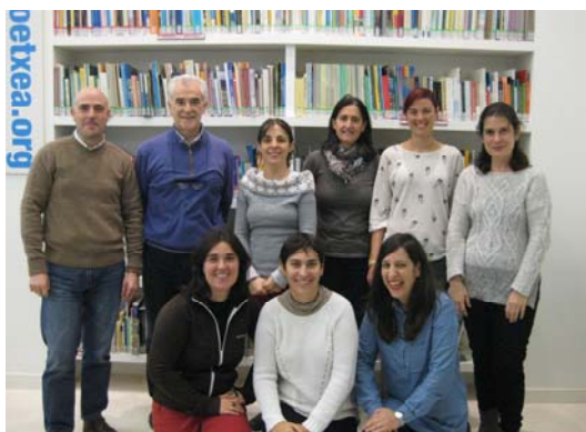
UNESCO Etxeko lan- taldea. 2014ko azaroaren 4a

Gainera: - 15 Boluntario egoitzan. - Eusko Jaurfartzarekin 12 bekadun UNESCO bulegotan Amerikan, Asian eta Afrikan - BBK Fundazioarekin 1 bekadun en UNESCOren Pariseko egoitzan.