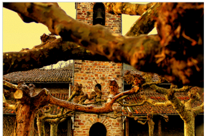
Europako Kontseiluaren Monumentuen Nazioarteko Argazki Esperientzia 'Sabaia'. Paulo Albuaren argazkia, Urretxu – Zumarraga Ikastolako ikaslea

Gure nortasunaren funtsezko ezaugarria da betiere gure herrian Bakearen Kultura eta Giza Eskubideak bultzatzea: