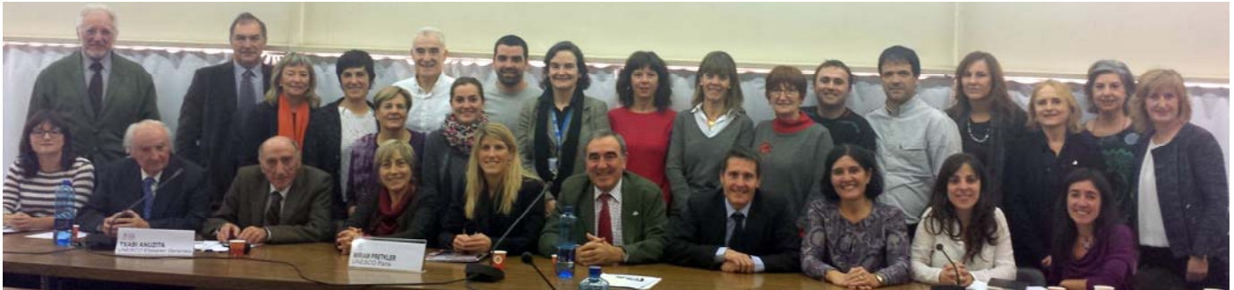
Euskal Herriko UNESCO Sarearen 1. topaketa. Deustuko Unibertsitatea, Bilbo. 2014ko abenduak 18

2014 inflexio-urtea izan da UNESCO Etxean. Izan ditugun barneko eta kanpoko inflexioek ez dute aldatzen gure funtsa, baina moldekatzen laguntzen digute, gure gizartearekin batera eboluzionatzen.