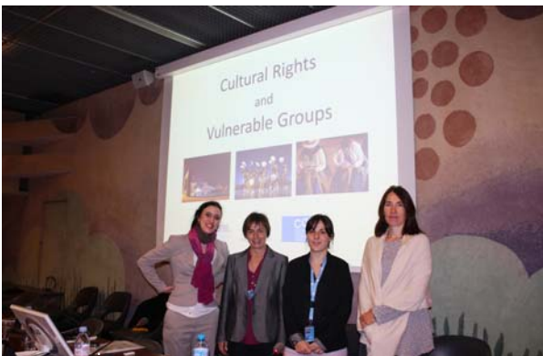
'Cultural rights and vulnerable groups' Ekitaldi paraleloa. Geneva, Suitza, 2015eko irailak 29

2015ean, UNESCO Etxeak kultura-aniztasuna sustatzeko premia defendatzen jarraitu du, ezinbesteko osagaia baita giza eskubideak eta gizarte bidezkoak bultzatzeko. Horrez gain, kultura Agenda 2030ean txertatzearen alde egiten jarraitu du, UNESCOko zuzendari nagusia buru duen kanpainarekin bat eginez.