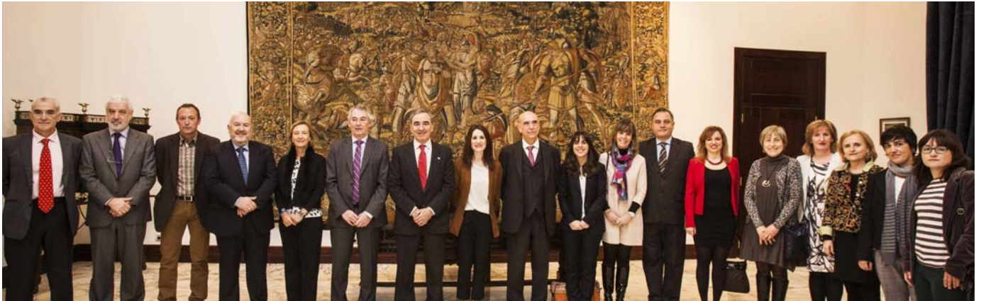
UNESCO sortu zeneko 70. urteurrena ospatzeko ekitaldia eta Euskal Herriko UNESCO Sarearen aurkezpena. Gasteiz, Eusko Legebiltzarra. 2015eko martxoak 16

UNESCO ETXEA-CENTRO UNESCO DEL PAIS VASCO (1991-2016) elkartearen sorreraren 25. urteurrena ospatzen ari gara. Urte hauetan guztietan ilusioz, konpromisoa eta ausardiarekin lan egin dugu gizarte bidezko, baketsu, iraunkor eta solidarioago baten alde. Horretarako, programa eta hitzarmen ugari jarri ditugu abian, gizarte gisa munduko debate eta erronketan parte har dezagun, gauzak modu engaiatu, kritiko eta arduratsuan eraikiz. 25 urte hauetan martxan jarritako askotariko ekimenen artean, gure lanaren erakusgarri iruditzen zaizkigun batzuk nabarmendu nahi ditugu, lagungarriak baitzaizkigu etorkinari sendo, baikor eta ekinez aurre egiteko.