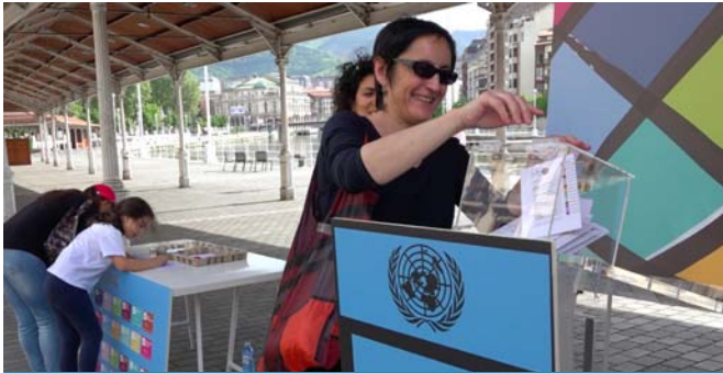
Nire Mundua. Kaleko ekintza, Nazio Batuen 'My world' kanpainarekin zerikusia duena. Bilbo, Basauri, Gasteiz eta Donostia. 2015eko maiatzaren 4,5 eta 6a

2015. urtea oso garrantzitsua izan da, nazioartean, giza garapen iraunkorraren arloan, eta, horri dagokionez, bereziki nabarmentzekoa da Agenda 2030 eta Garapen Iraunkorrerako Helburuak (GIH) onartu izana .