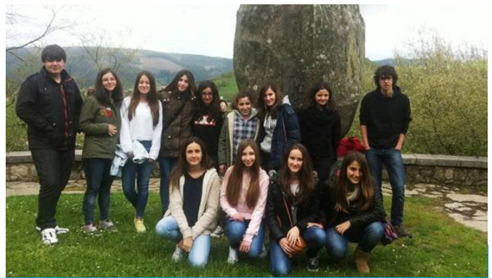
Ondare Mundiala den Labor Arteari buruzko Autonomien arteko 1. Topaketa Camargo, Kantabria. 2015eko apirilak 16 eta 17

2015ean, UNESCO Etxeak gure herrian Bake Kultura eta giza eskubideak sustatzen jarraitu du, prestakuntza- eta gogoeta-jardueren bidez.