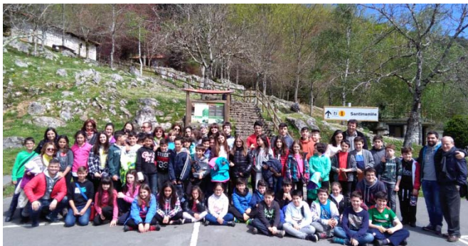
Munduko ondare den labar arteri buruzko II. topaketa. Santimamiñeko Kobazuloa, 2016ko apirilak 18 eta 19.

2016an, Bakearen Kultura eta giza eskubideak sustatzen jarraitu dugu, prestakuntza-jardueren bidez eta UNESCOren txostenak aurkeztuz.