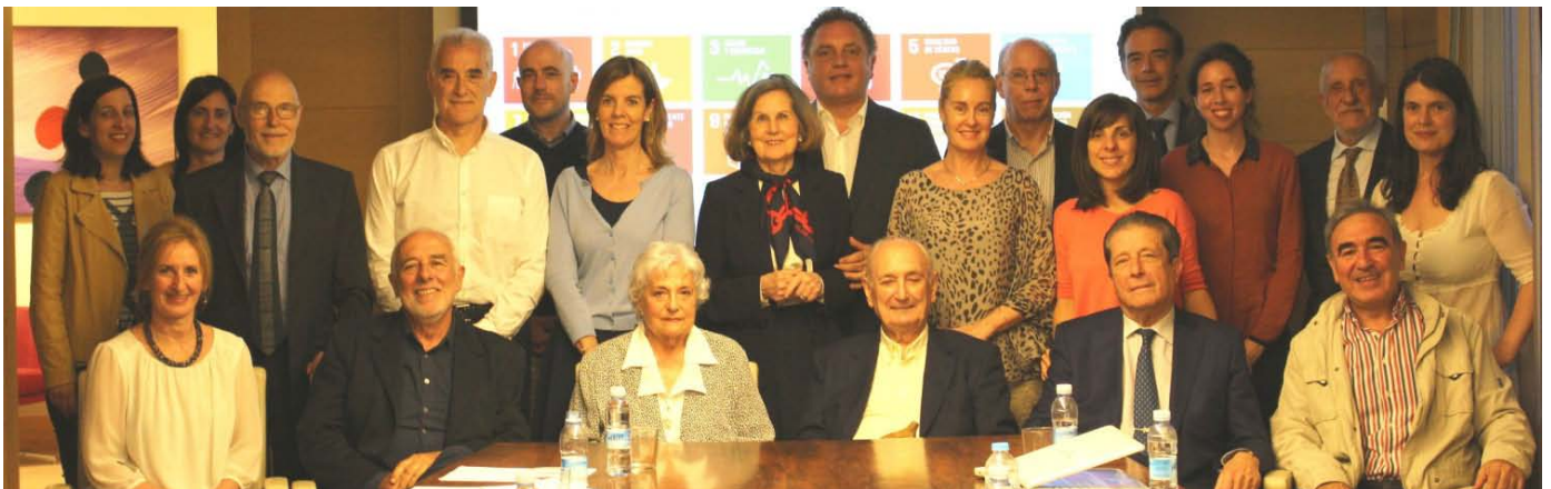
Ohorezko Bazkideen Aholku Batzordearen biurteko VI. topaketa. Bilbo, 2016ko ekainak 14 Ohorezko Bazkideak, Gobernu Kontseilua eta lan taldea.

2016 urtean izan dugu zer ospatua. Gure erakundeak 25 urte bete ditu, eta hori gauza handia eta pozgarria da benetan, urte hauetan guztietan etengabe lanerako izan dugun konpromisoaren, ahaleginaren eta irmotasunaren aitortza adierazten baitu. Mende laurdena bete dugu pertsona askoren laguntzari esker, askok jarduten baitute gurekin batera eraikitzen eta laguntzen, ilusioz beteta eta –hau ere esan beharra dago– erreferentetzat utopia hartuta. Ibiliko bidea ospatuz eta etorkizuna eraikiz, gure ahaleginetan erakunde eta pertsona asko izan ditugu laguntzaile, eta horiei guzties eskertu nahi diegu eman diguten babesa eta aitortza, bai eta adierazi ere elkarrekin hazten jarraitzea espero dugula.