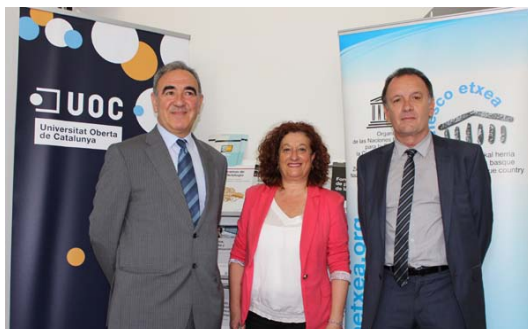
UNESCO Etxea Catalunyako Oberta Unibertsitateko puntu fokala izendatzen den akordioaren sinadura. Bilbo, 2016ko maiatzak 25

Gainera: 10 Boluntario egoitzan. Eusko Jauritaritzarekin 12 bekadun UNESCO bulegotan Amerikan, Asian eta Afrikan BBK Fundazioarekin 2 bekadun en UNESCOren Pariseko egoitzan.