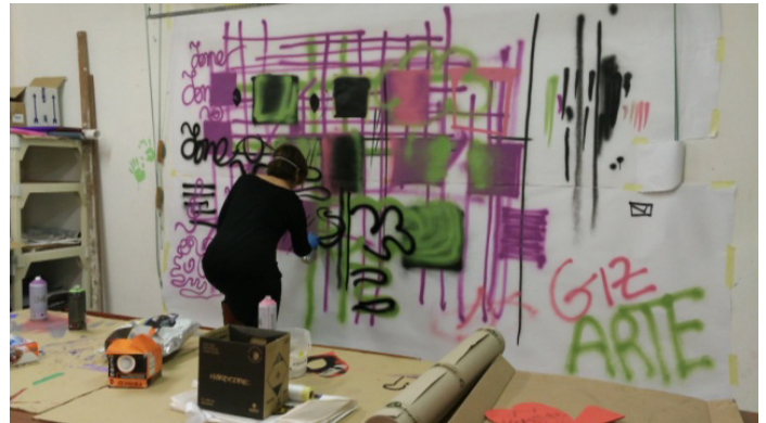
Hezkuntza, Arteak eta Herriak II. Mintegia. GizARTE – Eraldetarako Heziketa Artistikoen Euskal Sarearen aurkezpena. Bilbo. 2017ko azaroak 29 eta 30.

Gizarte eraldatzeko eta garapen iraunkorrerako aukerarik ez dago tokian tokiko eta munduko ezaugarri kulturalak kontuan hartzen ez badira. Ikuspegi hori kontuan hartuta, UNESCO Etxeak lan-lerro sendoa hasi du 2017an. Agerian jartzen du gizarte-eraldaketarako hezkuntzaren erronka nagusiei aurre egiterakoan kulturak eta adierazpen kulturalen dibertsitateak duten boterea.