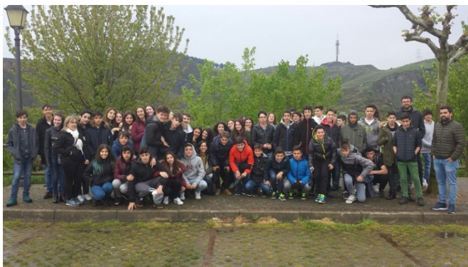
Ondare Industrialari buruzko topaketa, meatzaritzan oinarritutakoa. Arbolea (Trapagaran) eta Euskal Herriko Meatzaritzaren Museoa. 2017ko apirilak 25.

2017an, Hezkuntza, bake kultura eta giza eskubideak sustatzen jarraitu genuen, prestakuntza-jardueren bidez eta UNESCOren txostenak aurkeztuz.