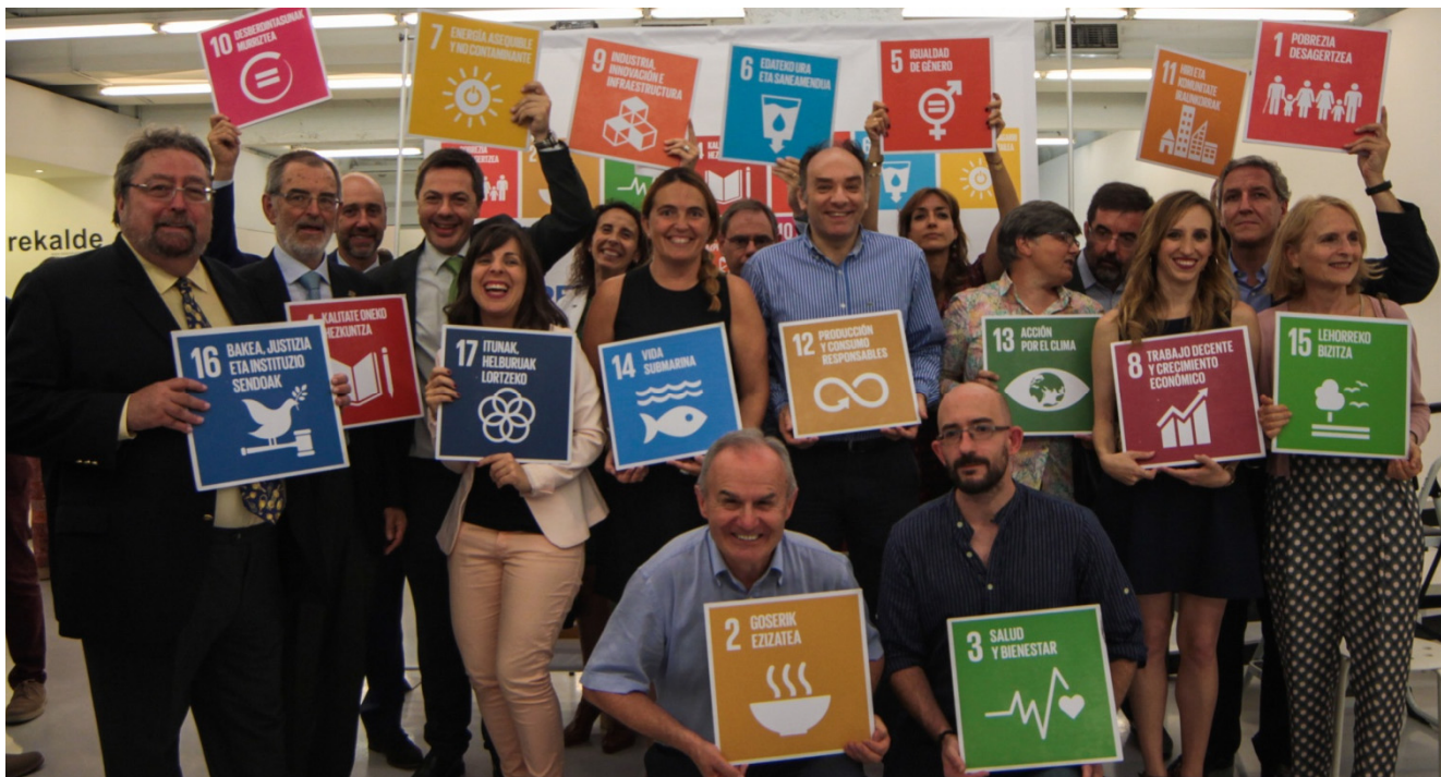
"17 entitate, 17 GIH" ekimenaren aurkezpena. #GIH17x17 Bilbo, 2017ko ekainak 22.

2017a urte ona izan da UNESCO Etxearentzat. Aldaketa handiko zenbait urteren ostean, erakunde moduan sendotzera bideratu ahal izan ditugu gure ahalegin eta baliabideak 2017an.