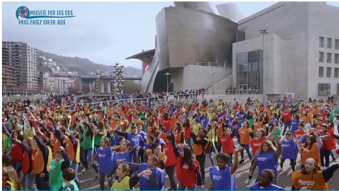
'Alda dezagun planetaren norabidea... mugitu zaitez GIH-en alde' kanpaina. Flashmob. Guggenheim Bilboko Museoa. 2017ko urriak 27.

2017an, gehitu egin genituen 2030 Agendari eta Garapen Iraunkorreko Helburuei (GIH) lotutako ekintzak, prestakuntza, sentsibilizazioa eta hedapen-lana; hala, nahi izan dugu euskal gizarteak konpromiso eta parte-hartze sendoa izatea guztiontzako etorkizun iraunkorrako eta bidezkoago bat eraikitzerakoan.