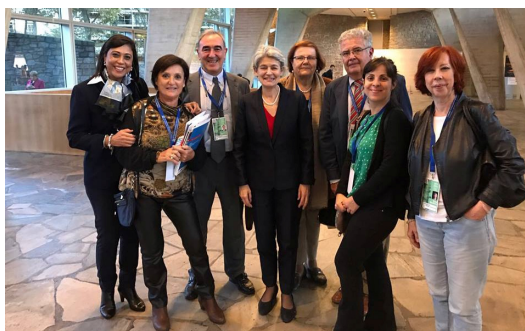
UNESCO Zentroen, Elkarten eta Kluben Espainiako Federazioa (FECU) UNESCOren 39. Biltzar Orokorrean. Paris, 2017ko urriak.

Gainera: 14 Boluntario egoitza. Eusko Jaurilitzarekin 12 bekadun UNESCO bulegotan Amerikan, Asian eta Afrikan BBK Fundazioarekin 2 bekadun en UNESCOren Pariseko egoitza.